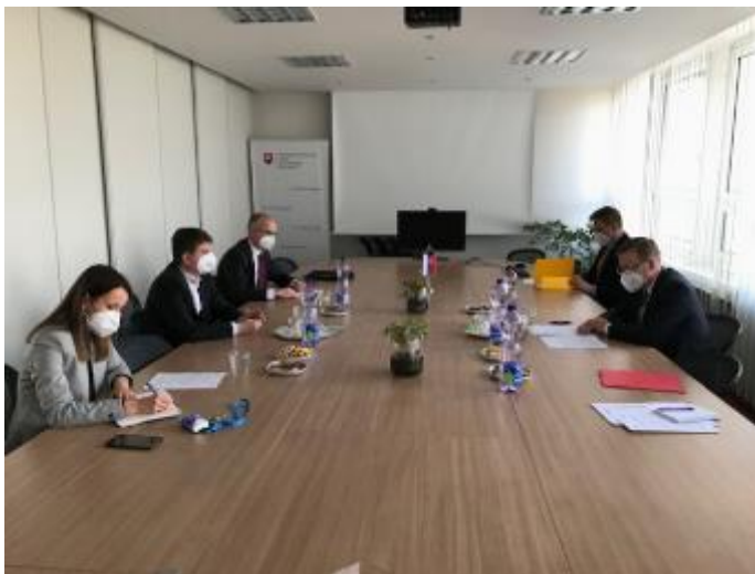
Predstavitelia PMÚ SR a ÚOHS počas pracovnej návštevy, 02. 02. 2022, Bratislava

V rámci ďalšieho rozvíjania bilaterálnej spolupráce s partnerským úradom na ochranu hospodárskej súťaže v Českej republike (ďalej len „ÚOHS“) predstavitelia PMÚ SR dňa 2. 2. 2022 privítali hostí z ÚOHS na pracovnej návšteve v Bratislave. Pre obe strany bola pracovná návšteva príležitosťou na podrobné prekonzultovanie viacerých aktuálnych výziev , ktorým v súčasnosti čelia obe inštitúcie a zároveň na zaujatie jednotného a čo najlepšieho postoja k riešeniu momentálnych otázok pri ochrane hospodárskej súťaže a presadzovaní jej princípov.