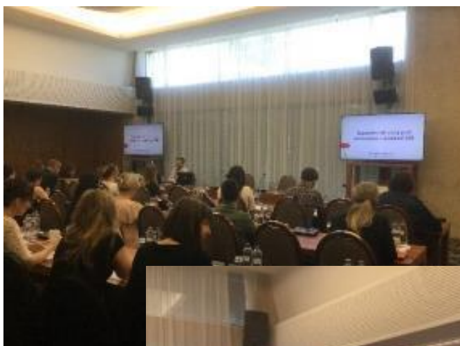
„Riadenie rizík a boj proti podvodom v prostredí EŠIF“, 12. 05. 2022, účelové zariadenie ÚV SR Hotel Bôrik, Bratislava