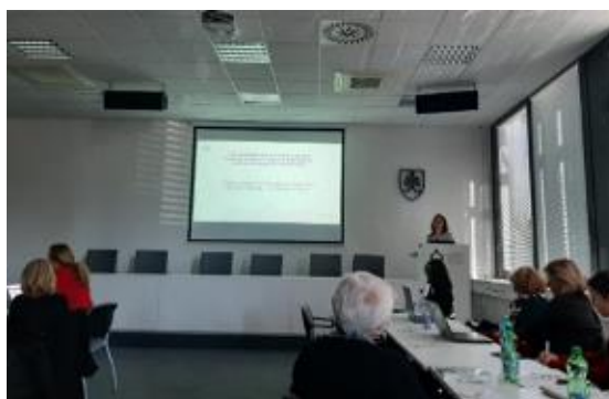
Vedecký park UK, Ilkovičova 8, Bratislava

Dňa 23. septembra 2022 prezentovala zamestnankyňa ONÚ OLAF na Diskusnom fóre: Vzdelávanie v oblasti finančnej gramotnosti v kocke tému OFZ EÚ a boj proti podvodom, ktorá je súčasťou výučby prierezovej témy Finančná gramotnosť na školách už od roku 2014. Organizátorom podujatia bol Štátny inštitút odborného vzdelávania, odbor Finančnej gramotnosti a Slovenského centra cvičných firiem a Úsek celoživotného vzdelávania. Partnerom podujatia bola Sektorová rada pre bankovníctvo, finančné služby, poisťovníctvo. V príspevku boli prezentované úlohy ONÚ OLAF a OLAF-u, ako aj vysvetlené základné pojmy, ktoré súvisia s témou OFZ EÚ a boja proti podvodom. Na praktickom príklade boli vysvetlené fázy protipodvodného cyklu. V príspevku boli uvedené trestné činy, ktoré sa týkajú poškodzovania finančných záujmov EÚ. V závere príspevku bol vysvetlený spôsob nahlasovania podozrení z nezrovnalostí a podvodov pri čerpaní prostriedkov EÚ. Viac informácií sa nachádza v tlačovej správe ONÚ OLAF zo dňa 28. 09. 2022.